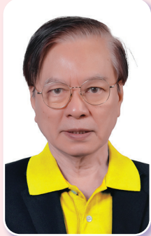
หมายเลข ๒