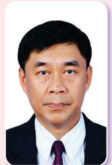
หมายเลข ๑๑